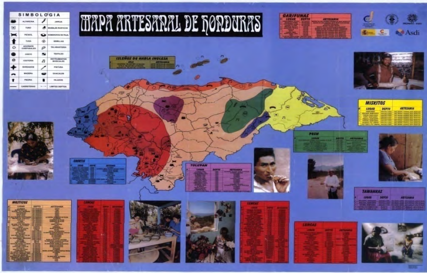
Fig. 3. “Mapa Artesanal de Honduras”, 1998-1999